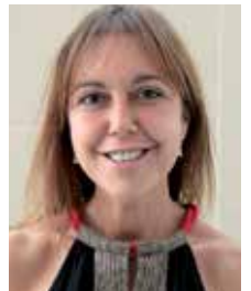
Rosa Funtané i Vilà Alcaldessa

Per finalitzar, us animo a participar de manera democràtica en les eleccions al Parlament de Catalunya convocades per al 27 de setembre, un esdeveniment molt important pel país, en què tots i totes estem implicats sigui quina sigui la nostra visió de futur. Com sempre, a l'Ajuntament i als col·legis electorals trobareu personal de suport que us podrà ajudar davant de qualsevol incidència o dubte que tingueu durant el desenvolupament de la jornada electoral.